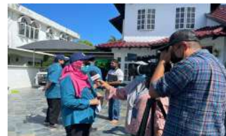
Sidang Media Program Turun Padang DOSM Negeri Johor Bersama Timbalan Pesuruhjaya Banci 2020