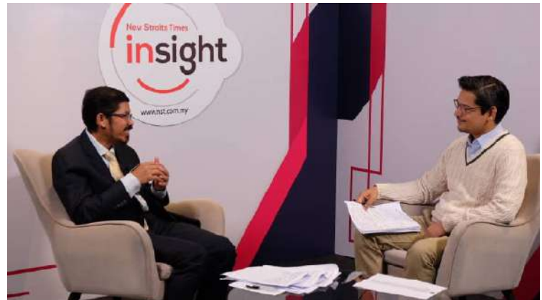
Wawancara fizikal Ketua Perangkawan di program NST Insight pada 22 April 2021

14 kali wawancara untuk program siaran TV 9 kali wawancara untuk program di radio 3 kali wawancara untuk media dalam talian