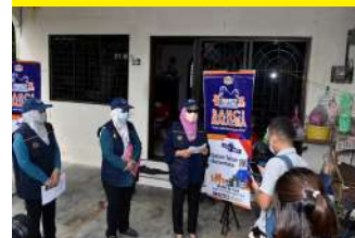
Sidang Media Program Turun Padang DOSM Negeri Perak Bersama Timbalan Pesuruhjaya Banci 2020