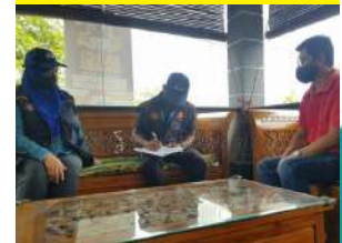
Sidang Media Program Turun Padang DOSM Negeri Melaka Bersama Timbalan Pesuruhjaya Banci 2020