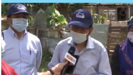
Sidang Media Program Turun Padang DOSM Negeri Sabah Bersama Pesuruhjaya Banci 2020