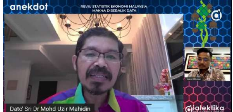
Wawancara di FB Live Dialektika TV bersama Ketua Perangkawan di program Anekdot pada 1 Jun 2021