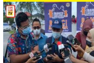
Sidang Media Program Turun Padang DOSM Negeri Terengganu Bersama Pesuruhjaya Banci 2020