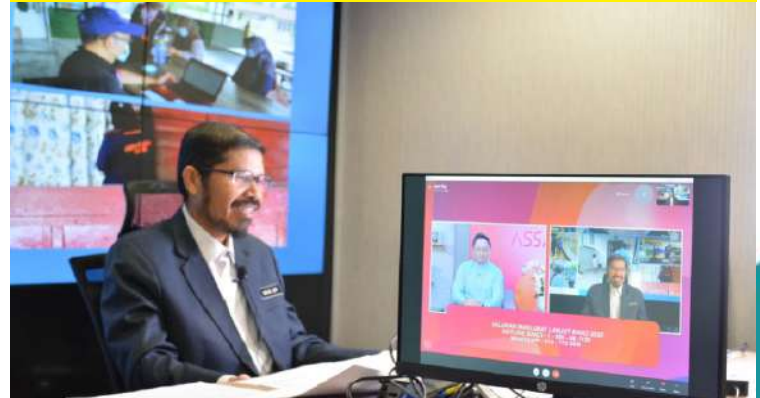
Wawancara maya (Google Meet) Ketua Perangkawan di rancangan Assalamualaikum pada 26 Mac 2021

ANTARA PROGRAM WAWANCARA YANG DIADAKAN DI STESEN TELEVISYEN, RADIO DAN MEDIA ONLINE TEMPATAN