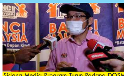
Sidang Media Program Turun Padang DOSM Negeri Selangor Bersama Pesuruhjaya Banci 2020