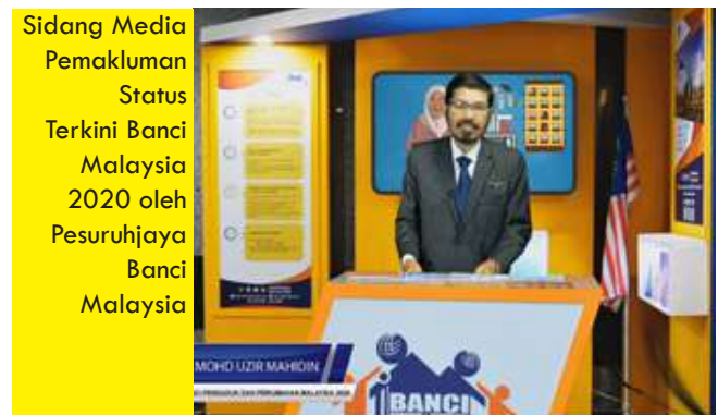
Sidang Media Pemakluman Status Terkini Banci Malaysia 2020 oleh Pesuruhjaya Banci Malaysia