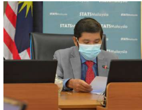
Sidang Media Pengumuman Data KDNK Negeri 2020 Oleh Ketua Perangkawan Malaysia Secara Maya