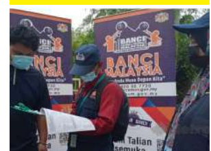
Sidang Media Program Turun Padang DOSM Negeri Kelantan Bersama Timbalan Pesuruhjaya Banci 2020