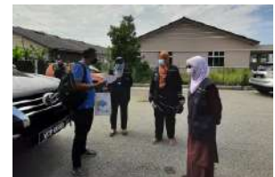
Sidang Media Program Turun Padang DOSM Negeri Pahang Bersama Timbalan Pesuruhjaya Banci 2020