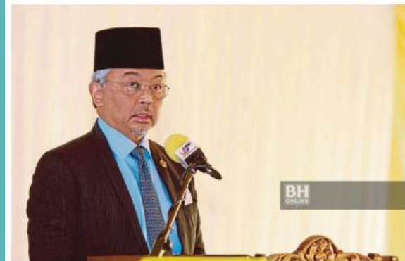
Yang di-Pertuan Agong Al-Sultan Abdullah Ri'ayatuddin Al-Mustafa Billah Shah berkenan menjadi responden pertama Banci 2020.

Majlis Perasmian Pelancaran Banci Malaysia 2020 https://www.facebook.com/mycensus2020/posts/1846411658831807