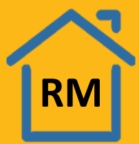
PENDAPATAN ISI RUMAH KASAR BULANAN, 2019 (Sepang)