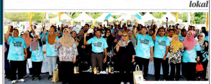
2500 Mahd Uzi dijemput berpindah bersama peserta pada majlis Perarakan Karnival Statistik 2022 sempena Majlis Sambutan HSN 2022.