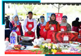
Mukim Batang Padang