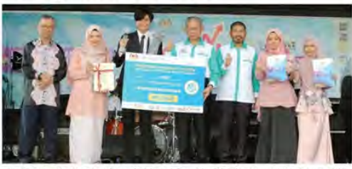
UIAM dinobatkan sebagai juara Pertandingan Akhir Debat Statistik yang julung kali diadakan sempena Hari Statistik Negara 2022.