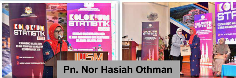
Pn. Nor Hasiah Othman

Kajian ini membentangkan cadangan penggunaan data Banci penduduk sebagai rangka untuk banci pertanian 2024. Berdasarkan pengalaman negara lain telah menunjukkan bahawa penyelarasan dan hubungan kedua-dua operasi dapat mengurangkan kos, menambah baik pembinaan rangka untuk banci pertanian serta meningkatkan kualiti keseluruhan banci.