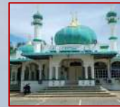
AHLI JAWATANKUASA MASJID JAME' AR-RAHMAN, PENDANG, KEDAH