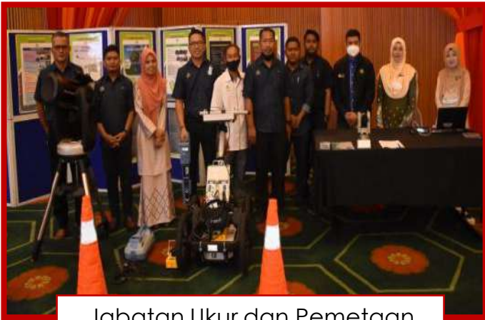
Jabatan Ukur dan Pemetaan Negeri Terengganu