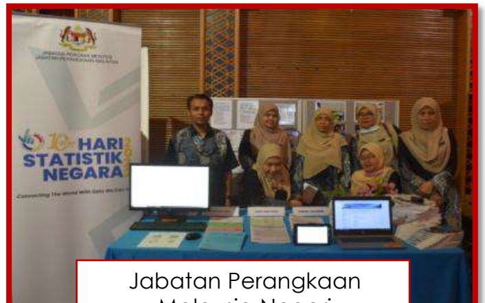
Jabatan Perangkaan Malaysia Negeri Terengganu