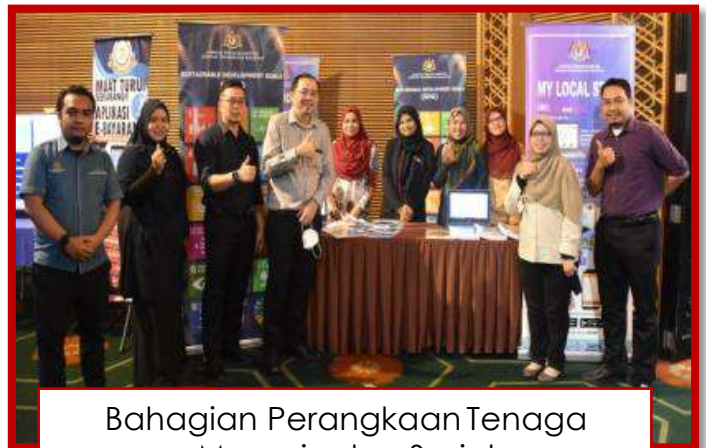
Bahagian Perangkaan Tenaga Manusia dan Sosial Jabatan Perangkaan Malaysia