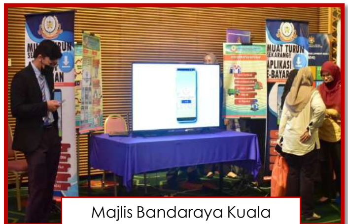
Majlis Bandaraya Kuala Terengganu,