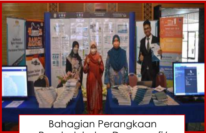
Bahagian Perangkaan Penduduk dan Demografi/ Core Team Data Raya Jabatan Perangkaan Malaysia